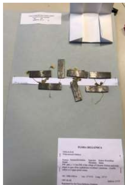
Collage de la plante