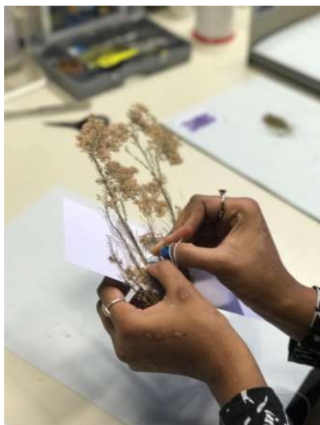
Couture de la plante

chercheurs et conservateurs de travailler correctement sur l'échantillon, sans en abîmer les composants.